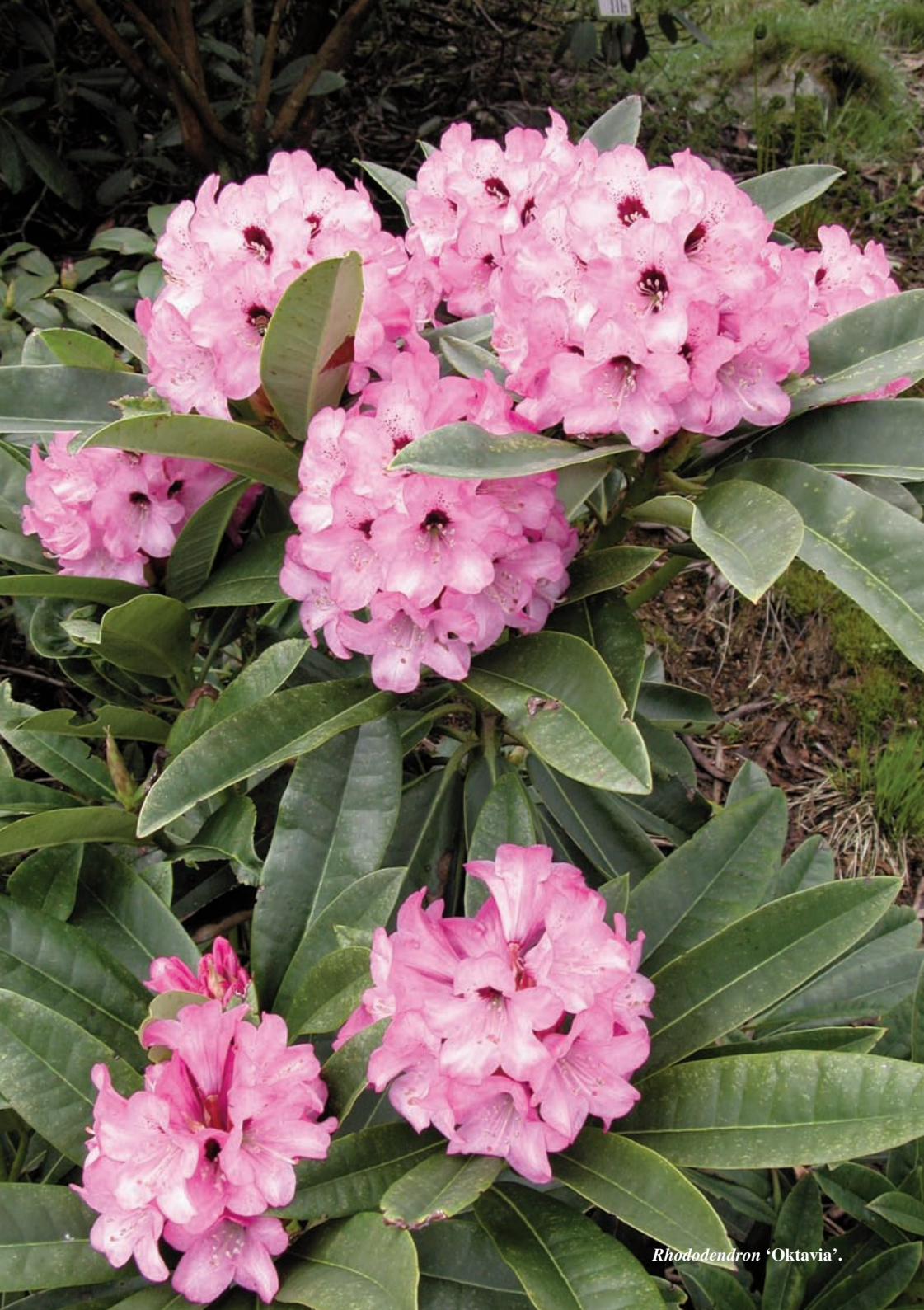
Rhododendron 'Oktavia' .