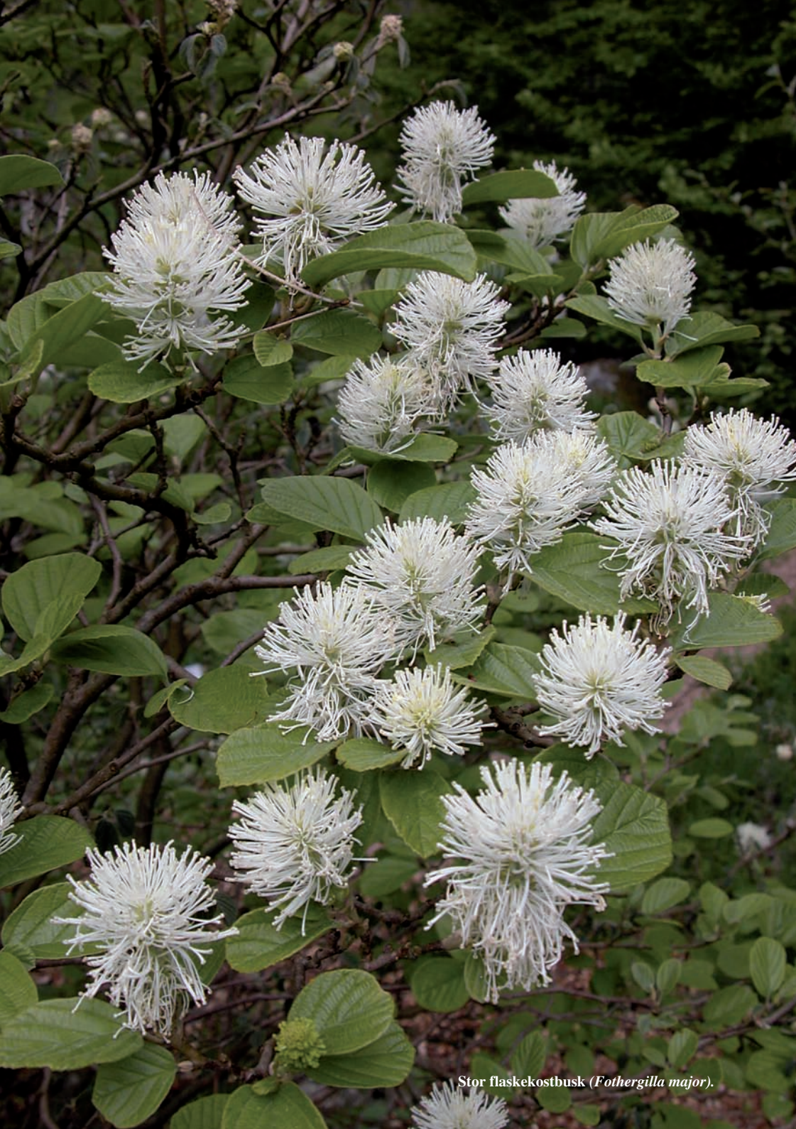
Stor flaskekostbusk ( Fothergilla major ).