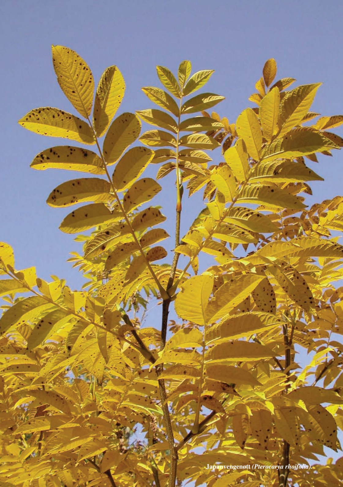
Japanvengenött ( Pterocarya rhoifolia ).