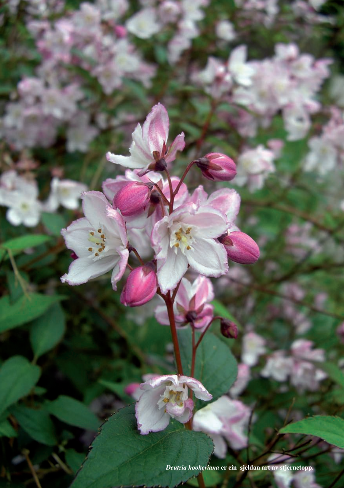
Deutzia hookeriana er ein sjeldan art av stjernetopp.