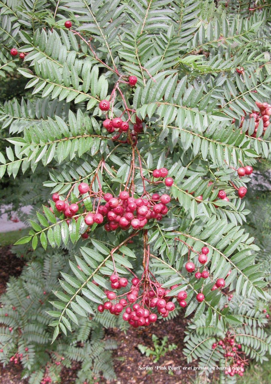
Sorbus 'Pink Pearl' er ei grasias og bærrik rogn